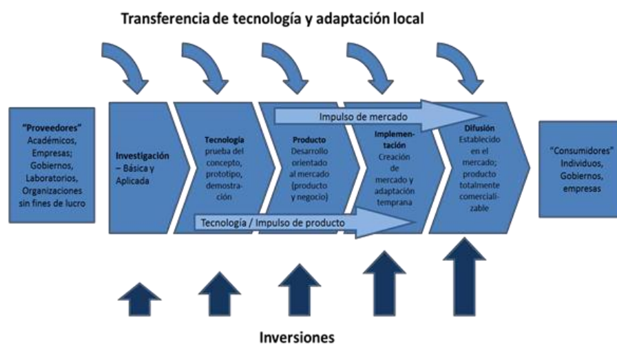
Gráfico 1: Etapas de la innovación tecnológica: una tipología

El proceso de innovación tecnológica está integrado por diferentes etapas –véase el Gráfico 1 para obtener un esquema estilizado 4 . Las innovaciones